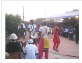
vue de l'accueil réservé à la Délégation Belge

Parti du fait que les services publics essentiels tels que, l'approvisionnement en eau potable, l'évacuation des eaux usées et de ruissellement, la facilitation des soins de santé, la préservation de l'environnement, la promotion du sport et de la culture, de l'éducation et de la formation, la consolidation d'un environnement social garantissant la liberté et la pratique religieuse, l'entretien et la démultiplication des infrastructures communautaires et Collectives et l'instauration de la sécurité publique autrement dit, les biens et services de proximité, ne peuvent être assurés que par les collectivités locales.