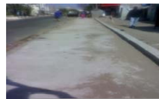
Les grands travaux de Grand-Dakar Une vue de la Rue GD 28 en rénovation